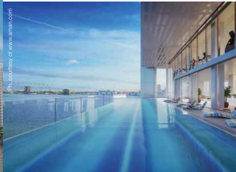
Missoni Baia Bayside Terrace Infinity Pool