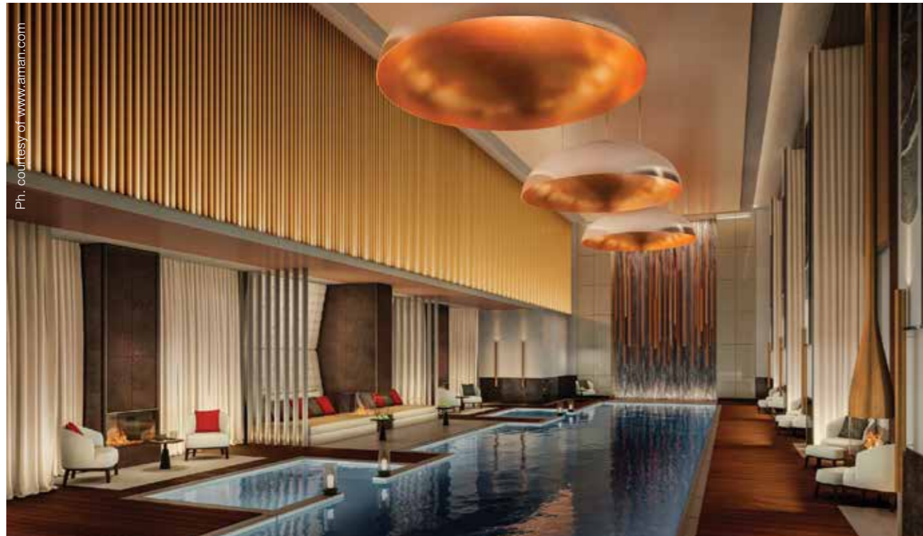
Aman New York - Spa Pool

redeveloping New York's iconic Crown Building near "Billionaire's Row", soon to be Aman New York. Doronin has a passion for working with the very best architects in the world.