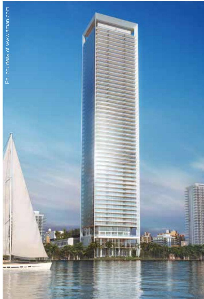
Missoni Baia Building