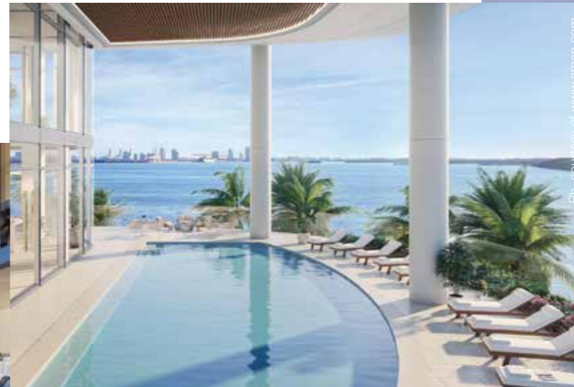
Una Residences North Pool Deck