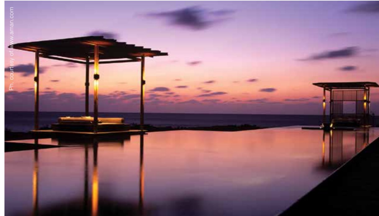
Amanyara, Turks and Caicos Swimming Pool

secluded countryside outside Moscow, designed by the great Zaha Hadid.