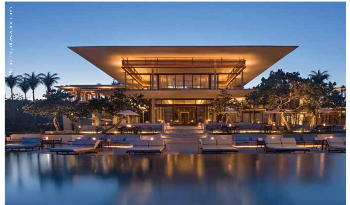
Amanera, Dominican Republic - Casa Grande

Doronin inizia poi a viaggiare al di fuori della Russia nel 1985, con solo 250 dollari in tasca. Vuole assorbire tutto, vedere tutto... Il Louvre a Parigi, Firenze, Roma e in-