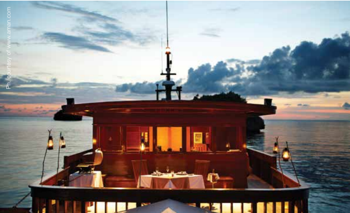
Amanikan, Indonesia - Upper Sundek