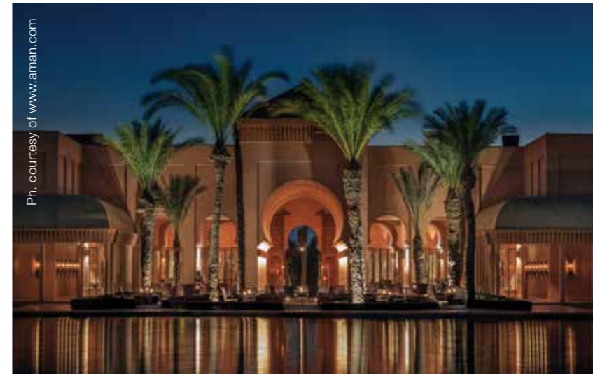
Amanjena, Morocco - General Resort &amp; Bassin