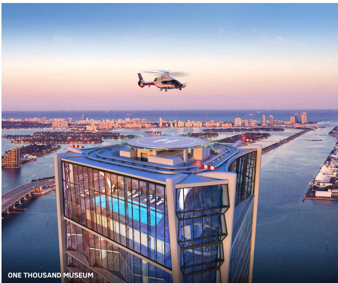
ONE THOUSAND MUSEUM

Эта жилая башня, спроектированная всемирно известной Захой Хадид, насчитывает более 60 этажей и представляет собой беспрецедентное сочетание искусства, архитектуры и дизайна, предлагающее шестизвездочный образ жизни. Ограниченная коллекция, состоящая из менее чем сотни квартир, включает в себя двухэтажные таунхаусы, полудвухэтажные жилые дома, двухэтажные и один двухэтажный пентхаус. Из этого сказочного