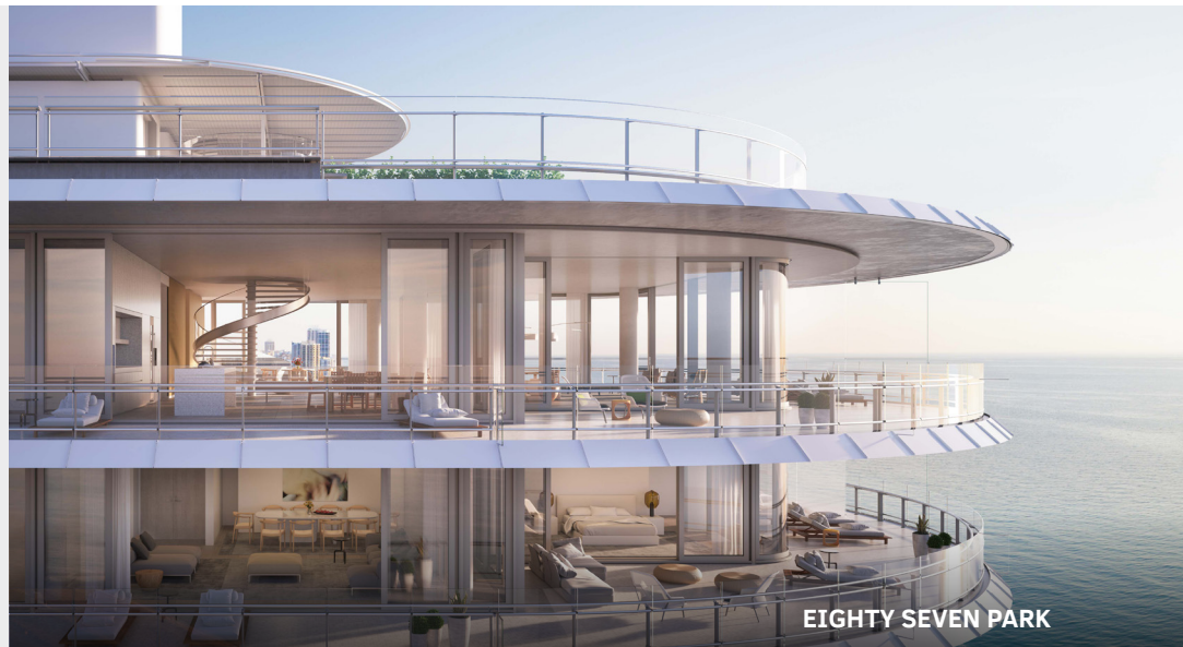
EIGHTY SEVEN PARK

Located in pristine Sunny Isles Beach on 4.5 beachfront acres, Acqualina Resort & Spa features 98 impeccably appointed guest rooms and suites and 188 residences with breathtaking views of the Atlantic Ocean, ranked number 1 beachfront resort in Continental America with AAA five diamond award.