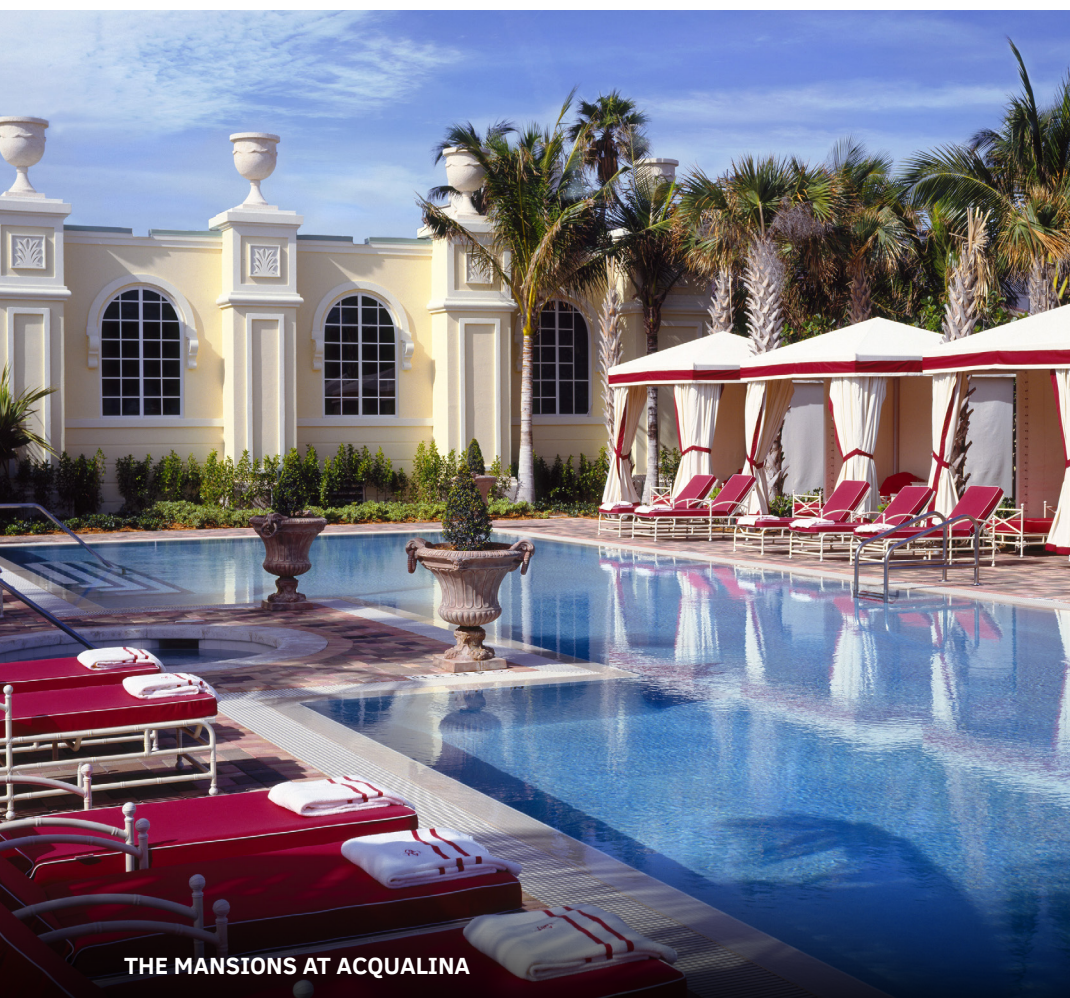
THE MANSIONS AT ACQUALINA