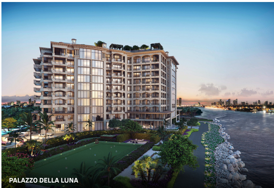
PALAZZO DELLA LUNA

здания открывается вид на залив Бискейн, художественный музей PAMM и музей науки Frost Science, а также на новую пристань для яхт в Майами.