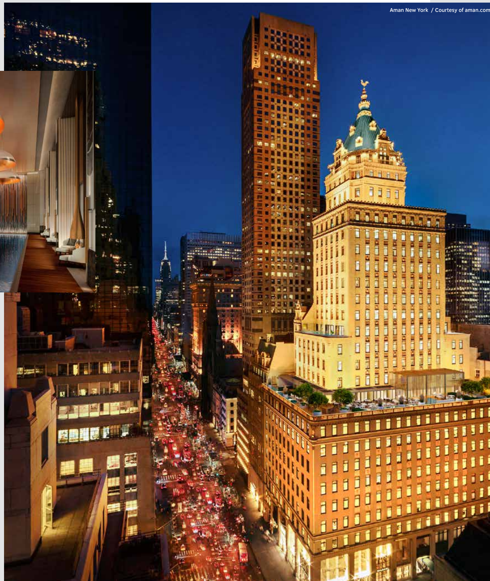
Aman New York